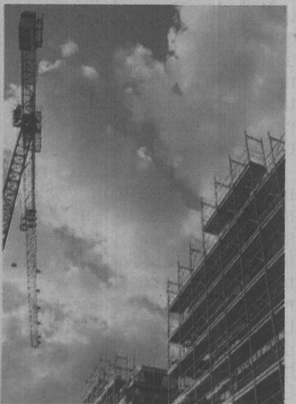
Lieve ripresa nelle costruzioni