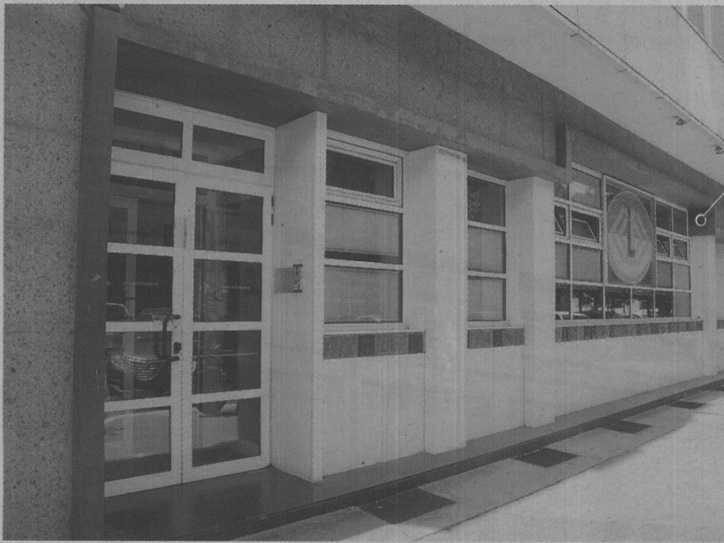
I dati sono elaborati da Excelsior per conto delle Camere di Commercio, accanto la sede di Latina.

■ Si va consolidando il sorpasso dei servizi sull'industria e si evince anche dall'andamento delle assunzioni del primo trimestre del 2017, pubblicato da Excelsior, il portale delle Camere di Commercio che segue il trend economico in tutte le province. E per quanto concerne Latina sulle 2.230 assunzioni del periodo compreso tra gennaio e marzo di quest'anno, 610 sono andate nell'industria e nell'edilizia, mentre 1.620 nei cosiddetti «servizi», di cui 590 nel commercio, 310 nel turismo e 170 nei servizi alla persona. Ma nell'industria c'è ancora maggiore stabilità, ossia è più alto il livello dei contratti fissi mentre nei servizi la stagionalità nei rapporti di lavoro in taluni casi supera il 30% del totale come nel caso dei servizi turistici, alloggio e ristorazione. Ciò significa che in quel settore si lavora solo nei periodi di massima domanda (praticamente in estate e nei ponti festivi) ed è questa una caratteristica che si protrae nel tempo nonostante gli sforzi annunciati per allungare quella che viene definita la stagionalità del turismo in provincia di Latina. Nello specifico i contratti in questo segmento dell'economia locale tra gennaio e marzo sono stati 310 di cui 220 (69,3% del totale) non stagionali e il 30,7 stagionali.