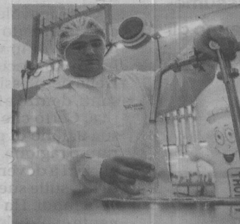
In laboratorio La trasformazione

Addirittura, denuncia la Coldiretti, tre cartoni di latte a lunga conservazione su quattro venduti in Italia sono stranieri, con la metà delle mozzarelle fatte con latte o ancor peggio cagliate provenienti dall'estero senza che questo sia stato finora mai riportato sull'etichetta. Acqua passata. Dall'entrata in vigore del nuovo provvedimento non solo dovrà essere noto a chi acquista l'indicazione di origine del latte o del latte usato come ingrediente nei prodotti lattiero-caseari oltre al paese di mungitura e di quello dove è avvenuta la trasformazione, ma anche se il latte usato come ingrediente nei prodotti lattiero-caseari è stato munto e trasformato nello stesso paese. Questo varrà non solo per le mucche, ma anche per le pe-