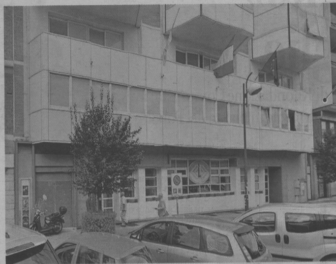
Accanto la sede della Camera di Commercio di via Umberto I a Latina

L'avviso dell'avvio del procedimento finalizzato allo scioglimento è stato notificato a tutti i consiglieri, dimissionari e non, alle associazioni imprenditoriali, sindacali e dei consumatori.