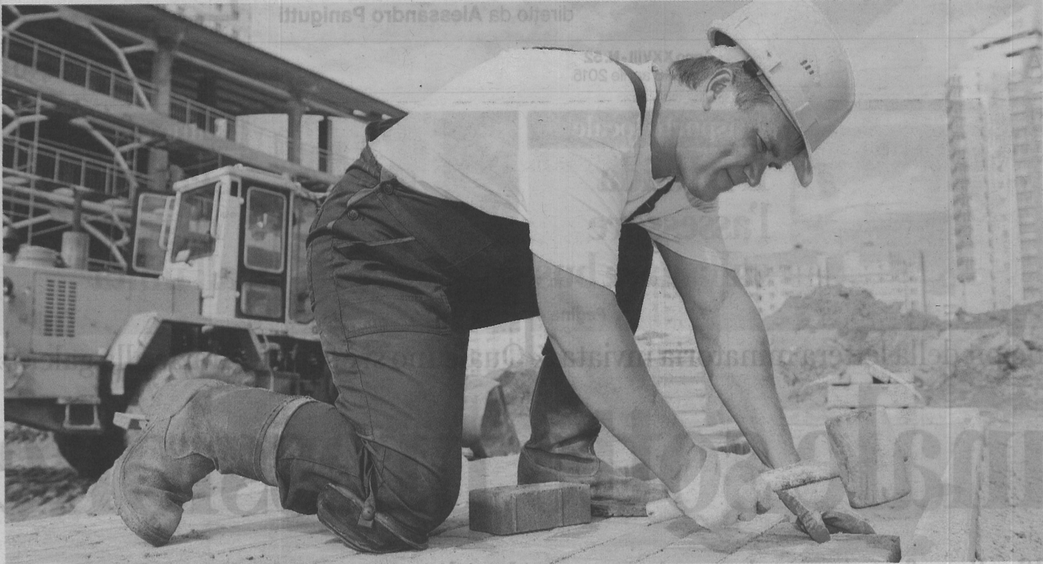
Aumenta il numero di dipendenti a tempo indeterminato nelle imprese pontine

L'indagine Rivelati i dati dello studio della Cna: a marzo un'impennata di assunzioni