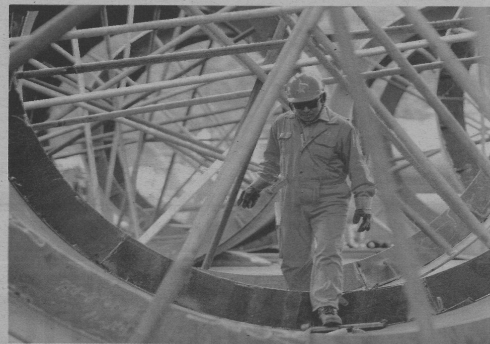
Da imprese e consumatori è arrivato uno slancio di ottimismo