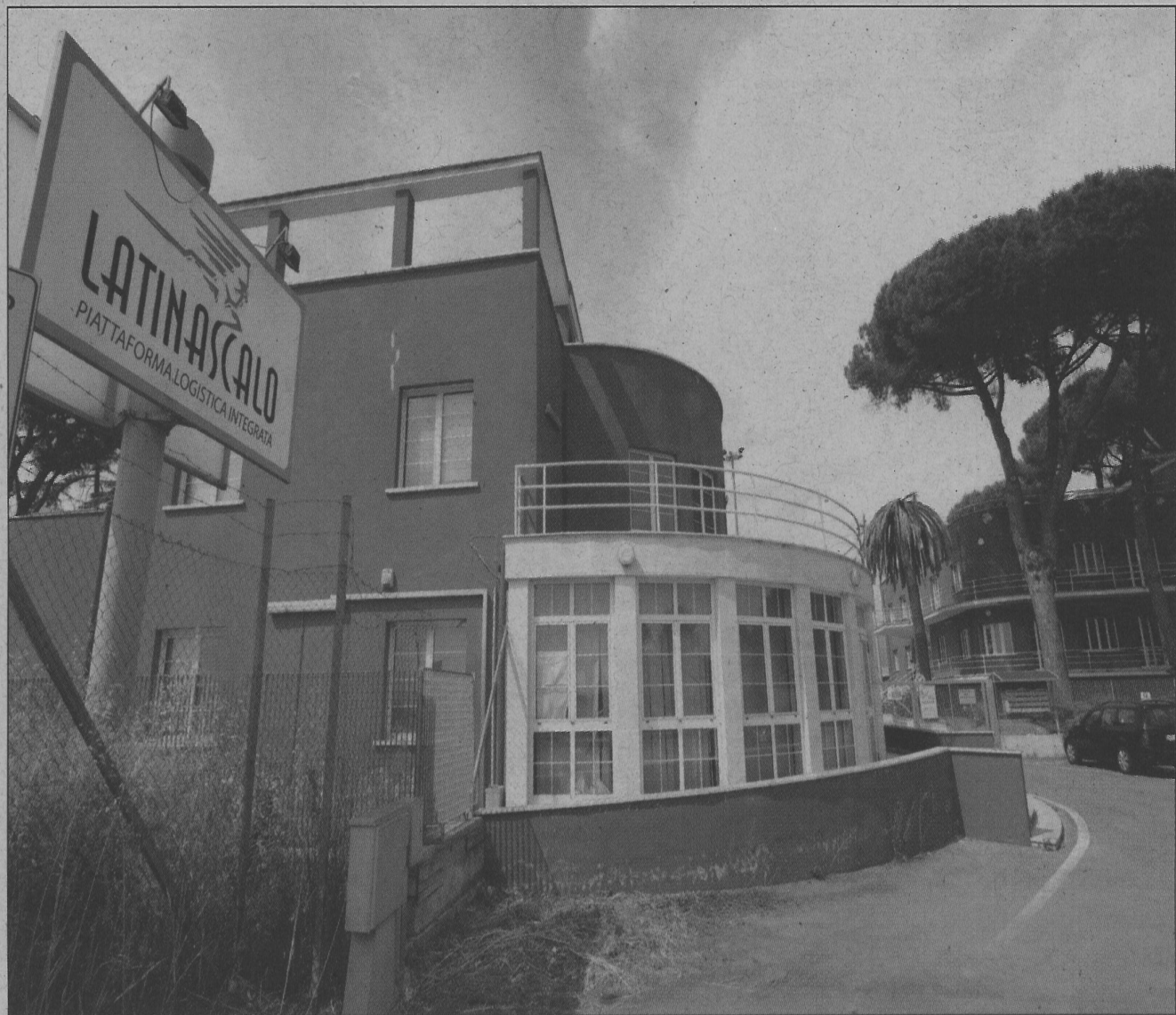
LA SEDE DELLA SLM DI LATINA SCALO

quindi, riguardo al futuro della nostra città, ma abbiamo agito nella massima trasparenza e anche celerità nella definizione della vicenda. Voglio esprimere grande apprezzamento e condivisione per il lavoro compiuto dal Professore Bernardino Quattrococchi, preside della facoltà di Economia dell'università Sapienza di Latina, con cui un rapporto di grande fiducia e stima per le sue competenze e capacità professionali. Il professor Quattrococchi ha svolto un'importante attività per la ricognizione, valutazione e valorizzazione della Piattaforma Logistica di Latina Scalo. Ritengo che il sito abbia tutte le caratteristiche per un rilancio della sue grandi potenzialità imprenditoriali e per la creazione di un hub logistico nella zona di Latina Scalo, visto anche che la piattaforma logistica non ha ancora espresso per intero il suo potenziale».