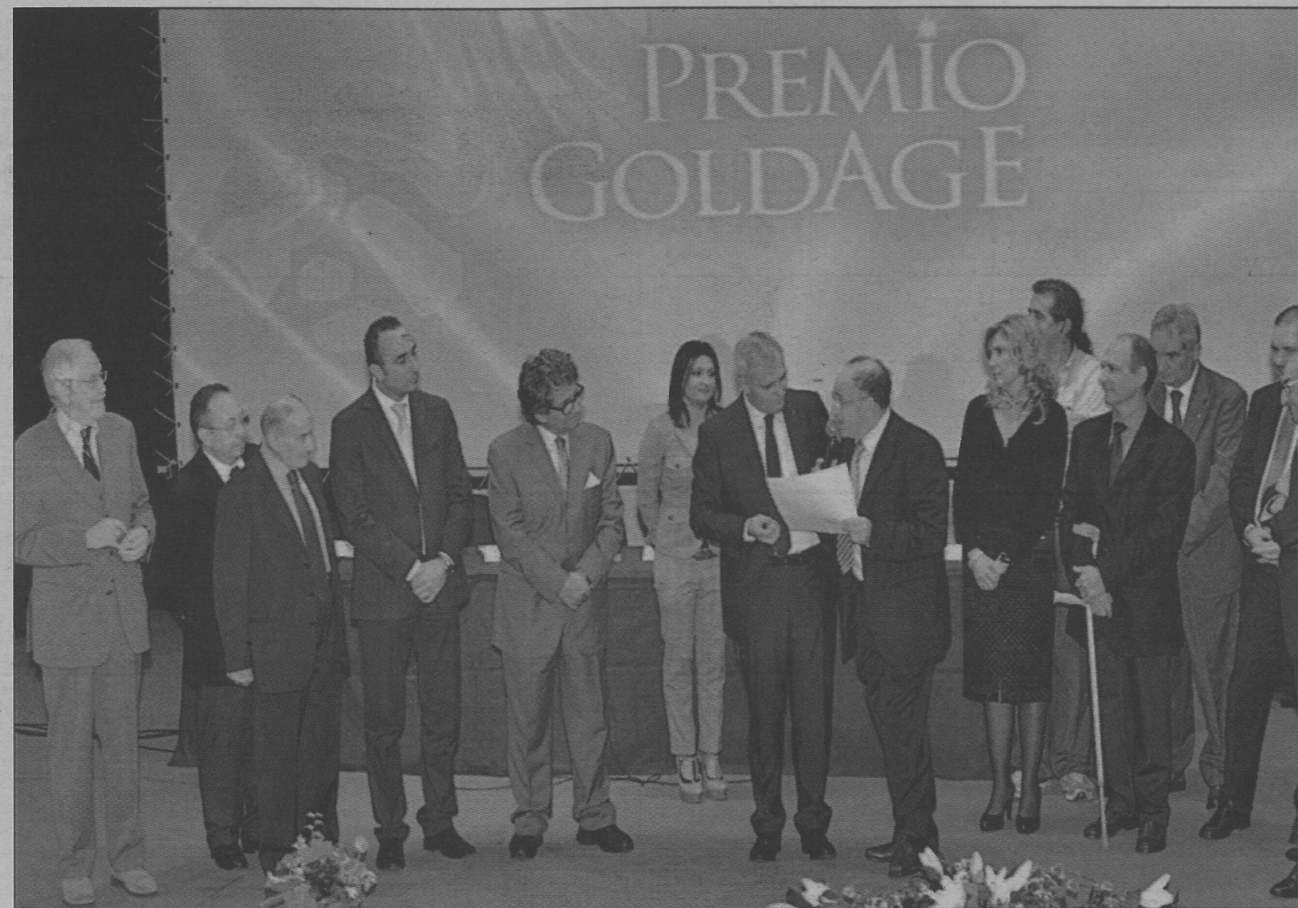
ALCUNI MOMENTI DELLA CERIMONIA DELL'ALIGHIERI