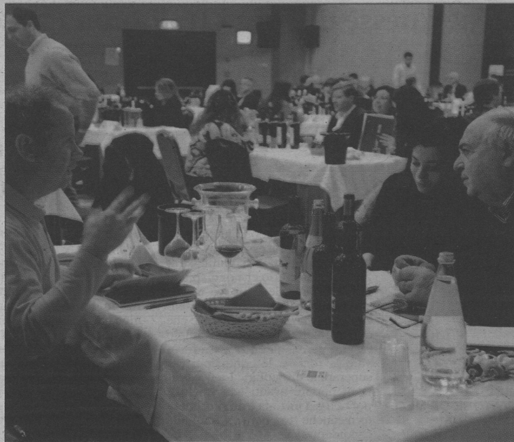
I TAVOLI DEGLI INCONTRI PER LO SVILUPPO DI RELAZIONI DI BUSINESS ALL'INTERNO DEL PROGRAMMA DI GASTRONOMICA RAPPRESENTANO UN CAPOSALDO DELL'EVENTO

Partecipati dai maggiori gruppi della Grande Distribuzione Organizzata, anche oltreconfine