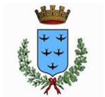
Comune di Aprilia