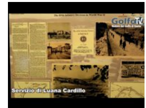
Gaeta - Maggio '44 "La nostra guerra"