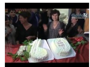
Gaeta - Il cinema teatro Ariston compie 60 anni