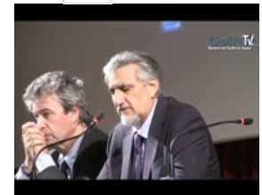
Gaeta - L'Istituto Nautico "G. Caboto" compie 160 anni