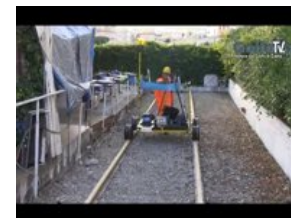
Gaeta - Nasce un comitato a favore della Littorina Gaeta -