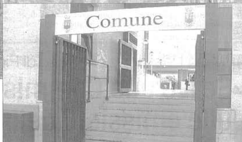
Filari di kiwi in una piantagione pontina e l'ingresso del Comune di Cisterna

Interventi e modalità per i rimborsi a seguito dei danni causati dalla batteriosi del kiwi. Se ne discuterà oggi in una importante assemblea pubblica che avrà inizio alle 17,30 all'interno della Sala consiliare del Comune di Cisterna. L'incontro dibattito sui provvedimenti regionali per la batteriosi del kiwi è stato organizzato dal Comune di Cisterna a capo del