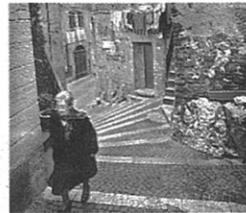
In basso: una scolaresca a Sermoneta. Da sinistra a destra: piazza Giovanni XXIII a Priverno; Sonnino; un vicolo di Bassiano