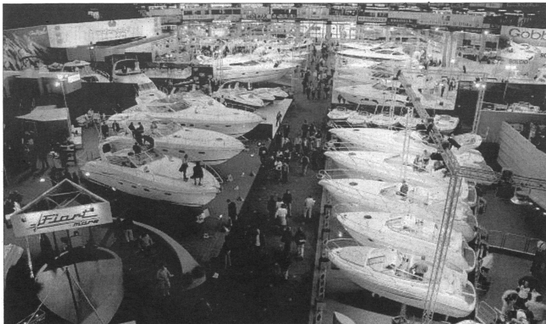
Nautica esposta a Genova

«Siamo a disposizione per favorire progettualità della portualità turistica»