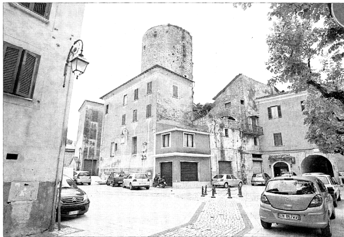
Piazza Garibaldi, al centro di Sonnino